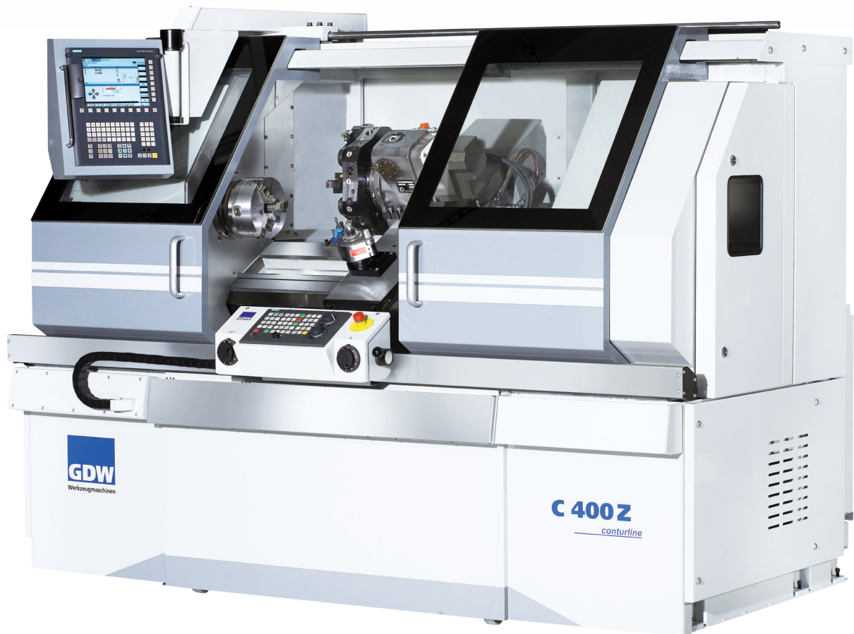
Abbildung mit Sonderausstattung

Ergonomische computerunterstützte Präzisions-Drehmaschine