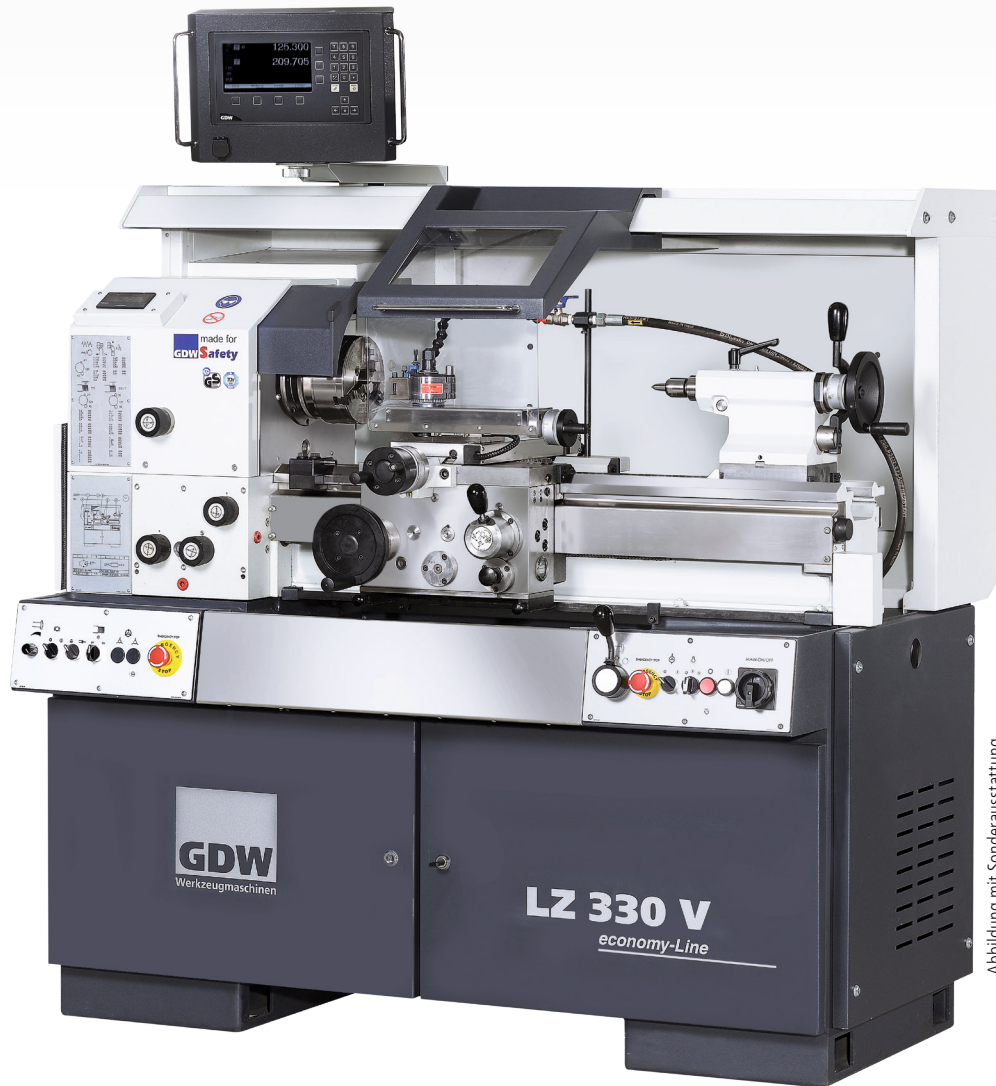
Abbildung mit Sonderausstattung